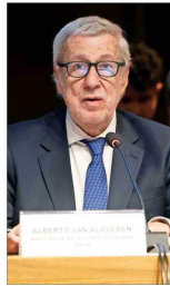
El canciller Alberto van Klaveren llamó a la calma por el anuncio de aranceles al cobre.

En este sentido, la ofensiva del gremio de aseguradoras estadounidenses contra la reforma de pensiones podría abrir un nuevo flanco. En una carta enviada al Presidente Gabriel Boric, las instituciones indicaron