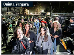
La jornada de anoche del festival fue postergada cuando ya había gente en el tradicional recinto viñamarino.