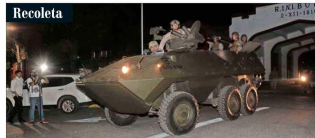
Efectivos militares se desplegaron para dar cumplimiento al toque de queda entre las 22:00 horas de anoche y las 06:00 de hoy.

Trescientos mil escolares que recién habían retomado sus estudios se quedan hoy sin clases, según el balance de La Moneda.