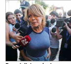
Especialistas plantean que zigzagueantes resoluciones pueden causar "confusión".

Excaldesa Barriga reingresa a prisión preventiva por tercera vez tras fallo de la corte | C10