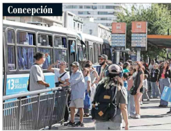
La capital del Biobío, una de tantas ciudades en que se produjeron aglomeraciones en los paraderos.