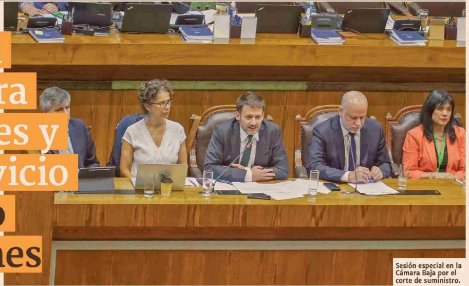
Sesión especial en la Cámara Baja por el corte de suministro.

Mientras el ministro de Energía llamó a que se analice con altura de miras la crisis, su par de Interior puso el acento en que la provisión de servicio eléctrico en Chile es de los privados.