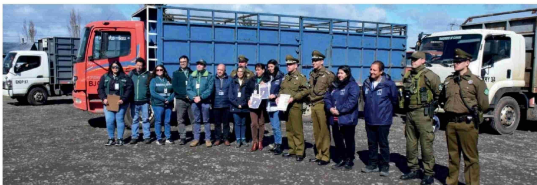
LA FISCALIZACIÓN por parte de autoridades se realizó durante la mañana de este lunes, en la Feria de Animales Tattersall.