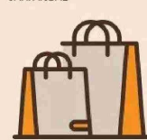
CONSUMO DE HOGARES POR REGIÓN VAR. ANUAL