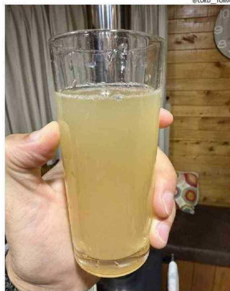
TOMÁS VÁSQUEZ PUBLICÓ EN SU CUENTA DE X (@LORD_TOMAS) ESTA FOTO MOSTRANDO LAS CONDICIONES EN QUE SE ENCUENTRA EL AGUA EN NERCÓN.