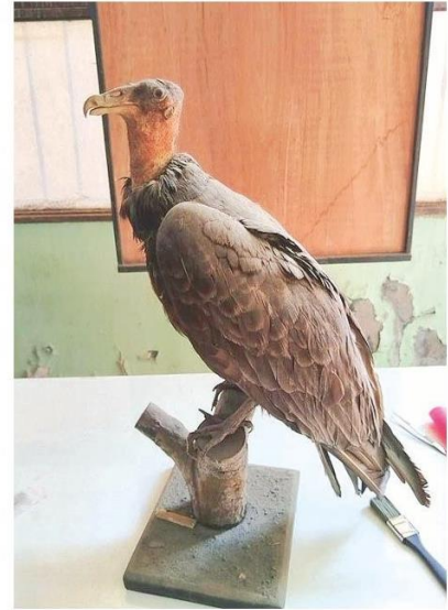
Jote, ave carroñera chilena.