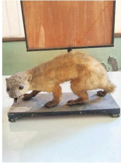
Marta, mamífero carnívoro apreciado por su piel.