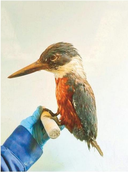
Martin Pescador, ave de distintas tonalidades que puede cazar bajo el agua.