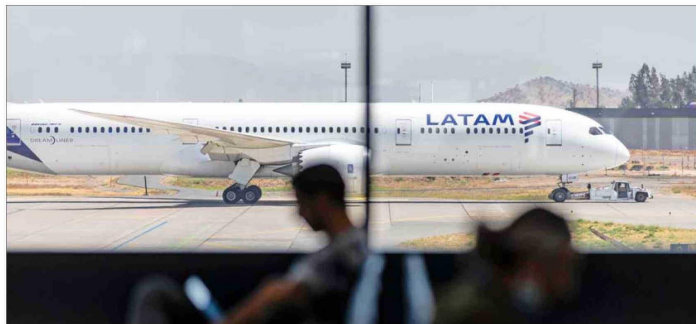
Latam Airlines Group es la aerolínea que más exportaciones transportó entre enero y noviembre de 2024.

Las principales exportaciones que se realizan a través del aeropuerto son productos que deben ser rápidamente transportados a donde serán consumidos (ver infografía). En ese sentido, el salmón corresponde al 62% de los