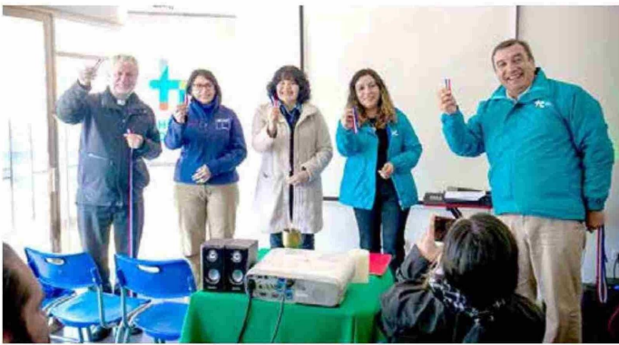
Autoridades destacaron la importancia de contar con este centro para las personas en situación de calle.

Apoyo. El programa de la Seremi de Desarrollo Social y Familia ha logrado brindar más de 12.500 prestaciones para 500 rut diferentes durante el primer semestre de este año.