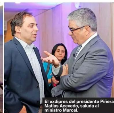
El exdipres del presidente Piñera, Matías Acevedo, saluda al ministro Marcel.