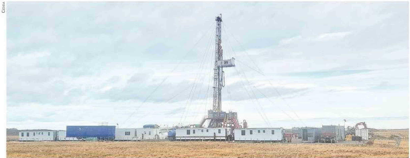
Equipo de perforación en pozo exploratorio Koo x-1

Tiraje: 5.200 Lectoría: 15.600 Favorabilidad: No Definida