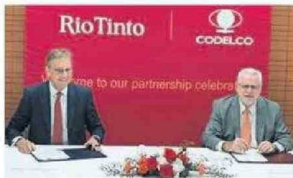
MINERAS YA HABÍAN FIRMADO UN CONVENIO.