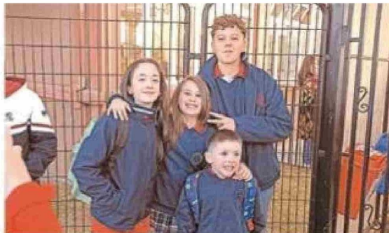
Distintas generaciones se reunieron en la entrada del Colegio Charles Darwin, uno de los primeros establecimientos en iniciar el año escolar en la región el pasado 27 de febrero.