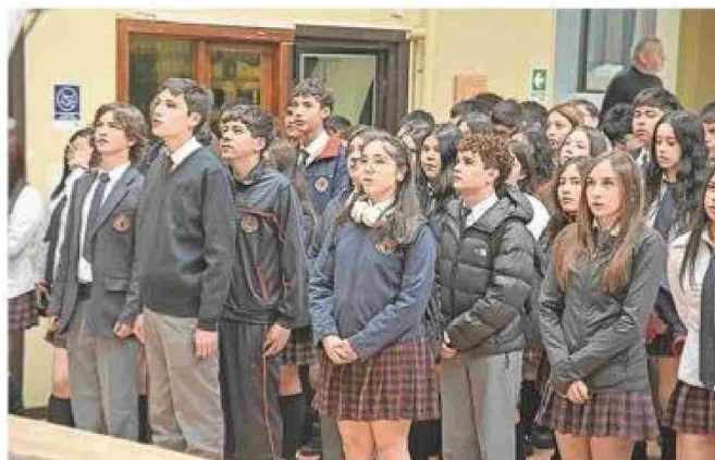
Los cuartos medios del Colegio Miguel de Cervantes durante el acto de iniciación del año escolar 2025.