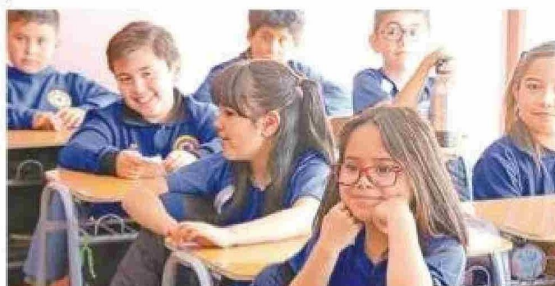
El tercero básico del Colegio Luterano comenzó sus clases a fines de febrero.