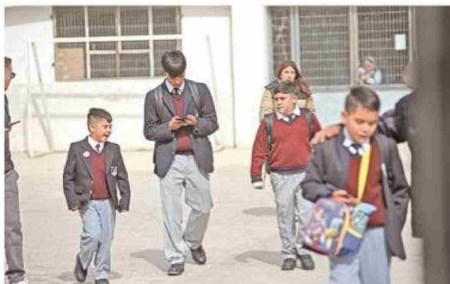
Los alumnos del Liceo San José al final de la primera jornada del año volviendo a sus domicilios.