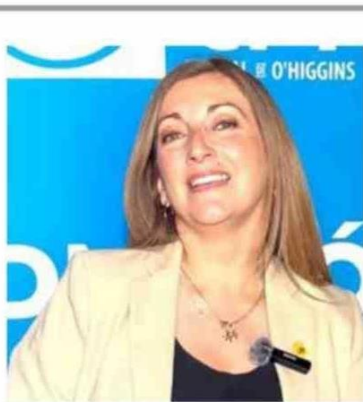
La Seremi de Educación, Alyson Hadad, subrayó la importancia del CFT Estatal de O'Higgins al señalar que "el rol que cumple hoy en día esta institución es fundamental, ya que forma a técnicos de nivel superior con altos estándares de calidad, capaces de responder a las necesidades de la región y del país. Este trabajo no solo impacta positivamente en la educación, sino que también fortalece el desarrollo económico y social, generando oportunidades concretas para jóvenes y adultos que buscan mejorar su calidad de vida a través del aprendizaje técnico y profesional".