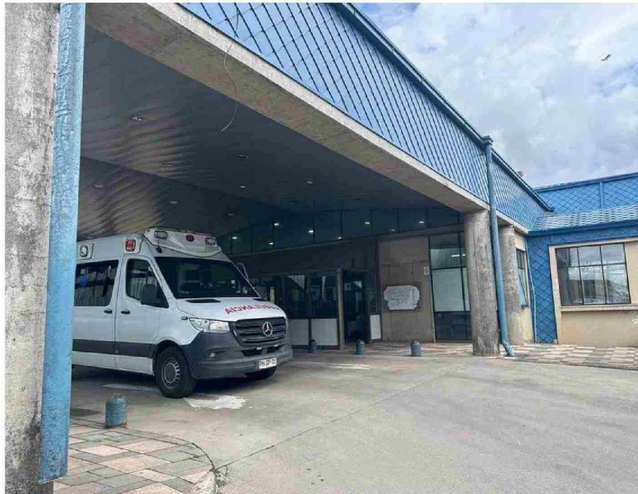
UNA MAYOR INFRAESTRUCTURA REQUIERE EL HOSPITAL DE CASTRO PARA TERMINAR CON EL COLAPSO DENUNCIADO POR DIRIGENTE.

Sobre las medidas adoptadas por la autoridad frente a la