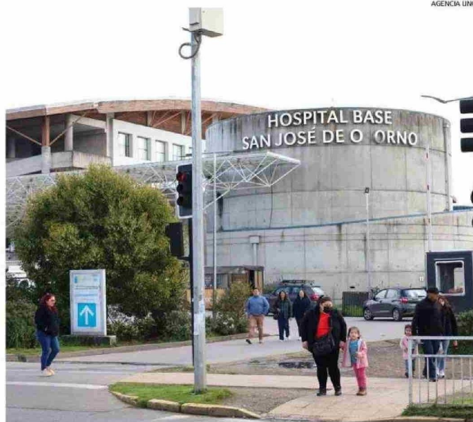
LA CONTRALORÍA DETECTÓ IRREGULARIDADES EN LAS LISTAS DE ESPERA DEL HOSPITAL DE OSORNO.