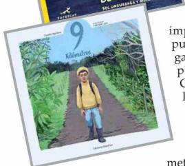
Algunos de los libros nacionales seleccionados entre los 150 más destacados y que se exponen durante la feria.

El premio a la Mejor Editorial Infantil del Año —que se divide por regiones—, tiene a dos chilenas en el área de América Central y Sur y el Caribe, compitiendo con dos argentinas y una brasileña, resultados que se conocerán durante la feria misma.