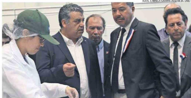
EL SITIO DE INSPECCIÓN FITOSANITARIA DE ATACAMA ES EL OCTAVO A NIVEL NACIONAL.