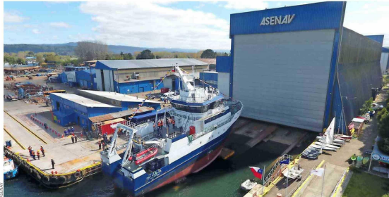
ASENAV ha estado marcada por el impacto positivo que ha generado entre las comunidades en que se desenvuelve.