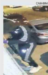
RECIBIÓ SU SENTENCIA.