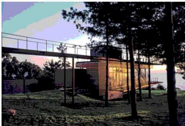
Un ejercicio de equilibrios y tensiones estructurales y programáticos implicó esta casa en Cantagua. 1998.