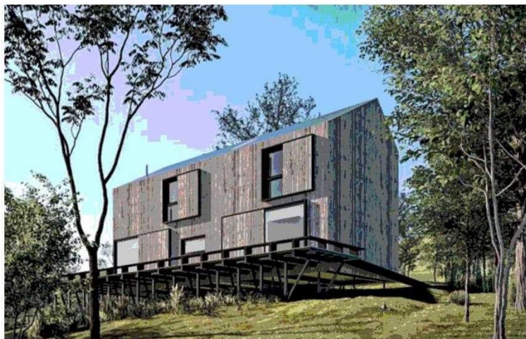
Proyecto en Buchupureo, uno de los 20 que tiene hoy.