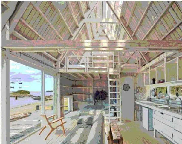
Una de las cabañas que tiene en Coldita, en un campo de 166 ha.