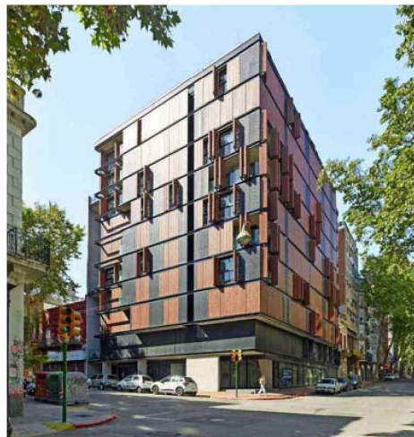
Edificio Alma Brava en Montevideo. 10 pisos de vivienda.

“Siempre hice las cosas para mí, viendo hasta dónde llegar con una estructura. No para destacar”, dice.