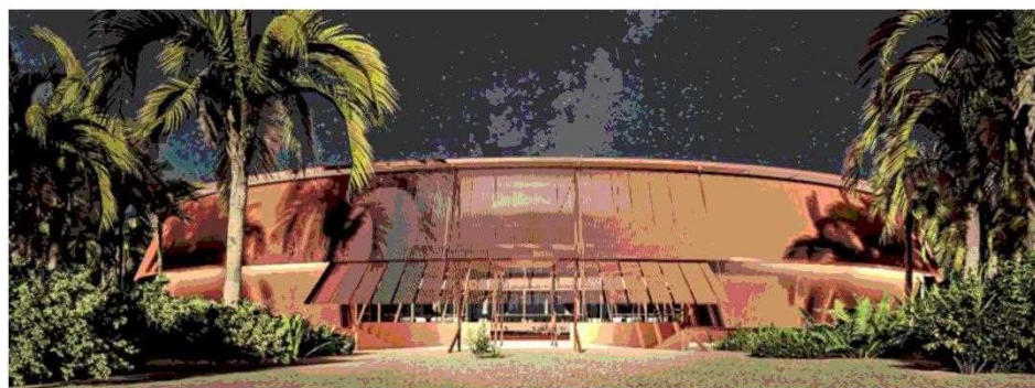
Hotel Armani Lobster Point que está proyectando en Barbuda.

vegando). Te das cuenta de que hay cosas que te resultaron bien, y otras más o menos no más". dice.