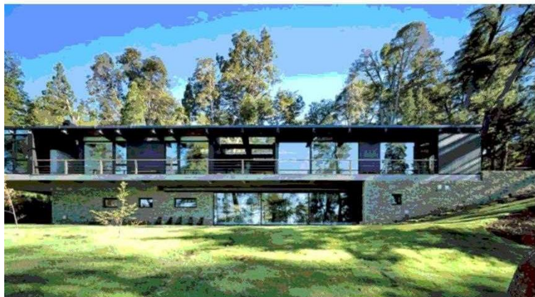
650 m² tiene esta casa en el lago Nahuelhuapi. Madera, cobre y hormigón.

Tiraje: 126.654 Lectoría: 320.543 Favorabilidad: No Definida