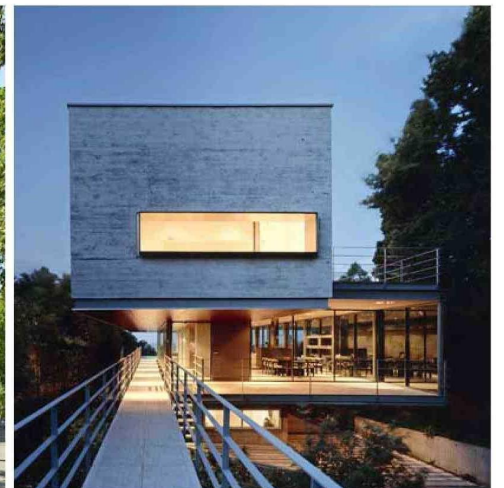
Una estructura desafiante tiene esta obra en Buenos Aires.

sa hacer la vida con ella, estar en sus actividades; compartir con los dos más grandes que estudian Arquitectura. Y obviamente el otro motivo es tener tiempo para viajar. Partí como ayudante de taller en 1998, entonces me pasé la vida entera en la universidad, y de verdad no lo echo de menos.