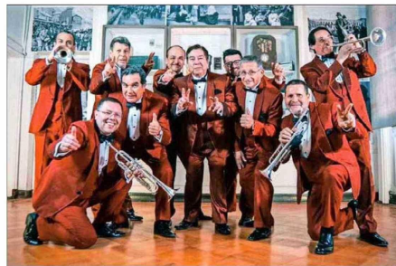
La Sonora de Tommy Rey participará el sábado en la cuenta pública de Santiago en el Teatro Municipal.