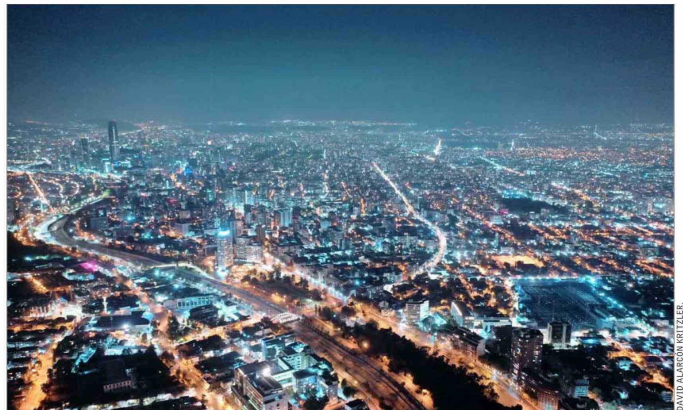
Se espera que la próxima semana se inicie la tramitación del proyecto que busca expandir a 4,7 millones los beneficiados por el subsidio eléctrico.

Este conjunto de reajustes, que afectan por ejemplo en la inflación, llevó al Gobierno a formular un proyecto de subsidios que comprometió ingresar a tramitación el 15 de agosto. Nuevas