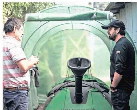
Invernaderos con riego tecnificado fue otro de los avances que el proyecto instaló en la isla.

Con este proyecto, el Gobierno Regional del Biobío y Desafío Levantemos Chile tuvieron como objetivo principal, además de instalar infraestructura y entregar servicios, generar vínculos con la comunidad, conociendo sus experiencias y entregando capacitaciones para el desarrollo eficiente y sostenible, mediante lo cual se facilitó el diálogo con los habitantes de Isla Mocha.