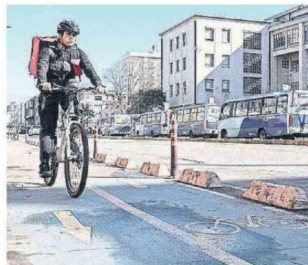
LOS CICLISTAS ESPERAN EN UN FUTURO TENER MÁS CONEXIONES