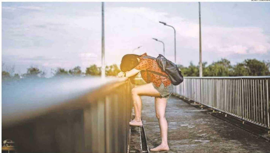
LA ORGANIZACIÓN MUNDIAL DE LA SALUD (OMS) ASEGURA QUE EL SUICIDIO ES UN PROBLEMA DE SALUD PÚBLICA A NIVEL GLOBAL.