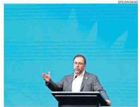
CANCILLER VENEZOLANO, YVAN GIL, DIJO QUE “ROMPIMOS TODA RELACIÓN”.