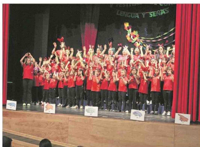
NIÑOS Y ADULTOS VISIBILIZARON LA LENGUA DE SEÑAS EN COMUNIDADES ESCOLARES INCLUSIVAS.

Establecimientos educacionales de Tocopilla participaron en esta actividad en el Teatro Municipal Andrés Pérez.