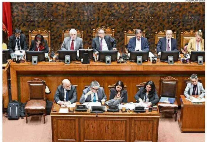
EL MINISTRO ÁLVARO ELIZALDE AFIRMÓ QUE UNA NORMA ASÍ DEBE SER PARTE DE UNA LEY PERMANENTE.