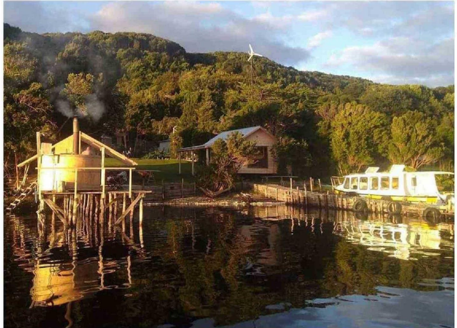
EL CAMPING LA ABUELA OFRECE UNA EXPERIENCIA ÚNICA EN CUCAO.