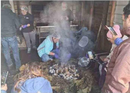
EN EL TURISMO RURAL, EL CURANTO AL HOYO ES UNA ESTRELLA.