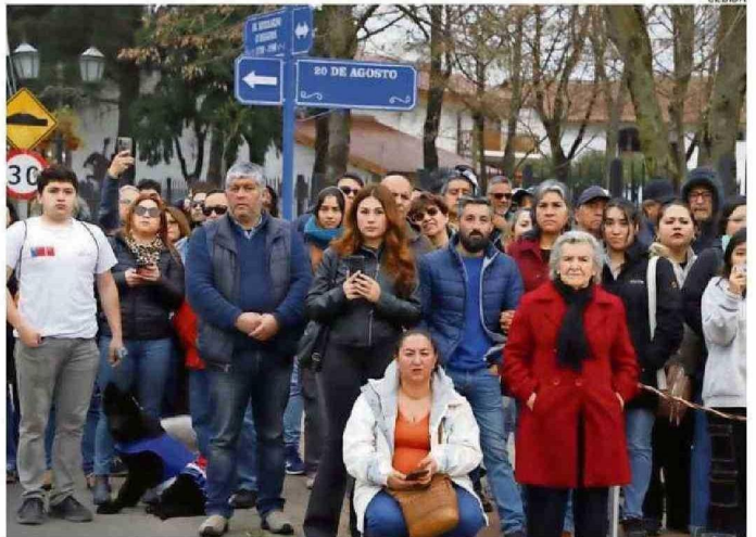
COMUNIDAD PARTICIPÓ EN ACTO CÍVICO MILITAR EN HONOR A LAS GLORIAS DEL EJÉRCITO.