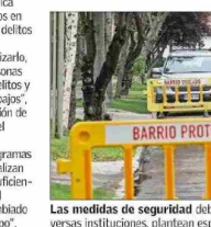
Las medidas de seguridad deben involucrar un esfuerzo mancomunado entre diversas instituciones, plantean especialistas.

Añade que "luego la estrategia debe considerar incentivos económicos para las familias y municipios para la reinserción escolar de jóvenes desahuciados, instalación de 'oficinas de oportunidades laborales' de cooperación público-privada para dar trabajos lícitos a jóvenes y adultos".