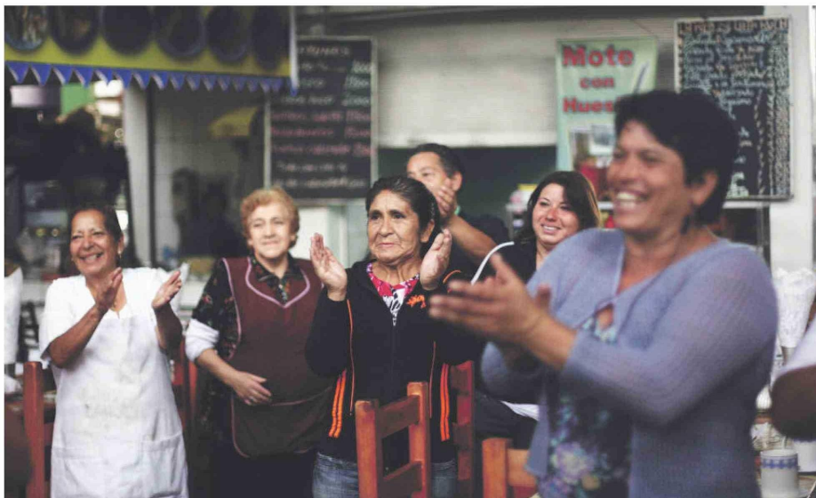
Apoyo. En nuestro país existen programas especiales para potenciar a las mujeres emprendedoras.