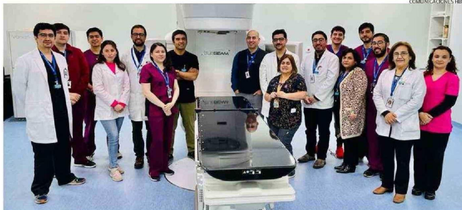
EL EQUIPO DEL SERVICIO DE ONCOLOGÍA Y RADIOTERAPIA DEL HOSPITAL BASE VALDIVIA.

ciones, lo que por ejemplo permite que un paciente de Coyhaique o Chiloé pueda regresar a su hogar el mismo día del tratamiento; en comparación a las técnicas tradicionales cuya duración va entre las 2 a 6 semanas”.