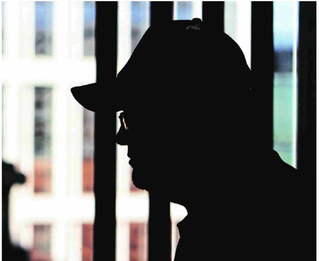
► Para la audiencia, Gendarmería solicitó que los imputados no se movieran de sus cárceles debido a su peligrosidad.

Y es que a esa hora la jueza del 11° Juzgado de Garantía de Santiago ya tenía en su poder -según lo expuso en la audiencia- un informe enviado por Gendarmería, y al que tuvo acceso La Tercera , en el que la institución pedía al tribunal que los integrantes de Los Piratas no fueran trasladados al tribunal “por razones de seguridad para minimizar cualquier riesgo o escenario que pudiera afectar la esfera de custodia”.