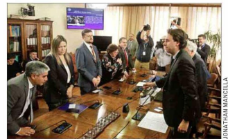
La comisión Vivanco, del oficialismo y la DC.