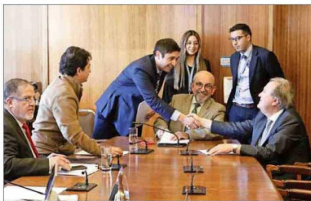
Momento en que se constituyó la comisión afín.