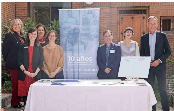
Integrantes de la Fundación Honra, SernamEG y de la Embajada de Canadá, participantes en la creación del folleto.