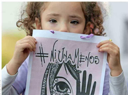
El folleto entrega diversas instrucciones para evitar la violencia de género.