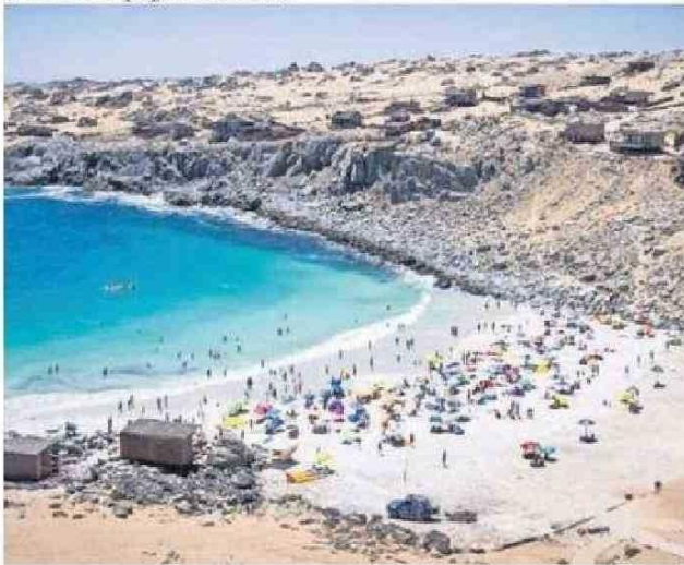
PLAYA LA VIRGEN TAMBIÉN PREDOMINA ENTRE LAS OPCIONES.