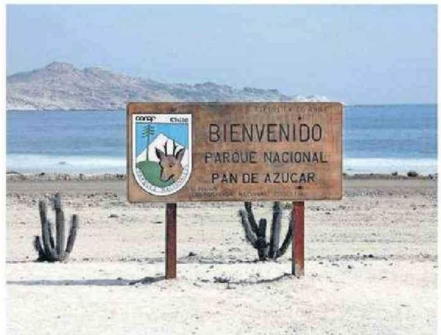
EL PARQUE NACIONAL PAN DE AZÚCAR ES UNO DE LOS DESTINOS.

Desde Sernatur también destacaron, para los más aventureros, la disponibilidad de la ruta de los seismiles, que contempla paisajes increíbles en la montaña. Y, más cerca de la capital regional Copiapó, se puede visitar igualmente el mar de dunas y aprovechar los atardeceres que caracterizan al norte chico del país.