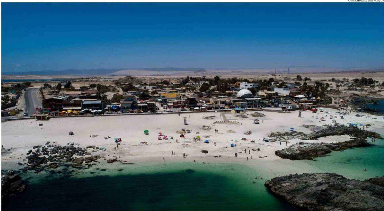
BAHÍA INGLESA CONTINÚA SIENDO UNO DE LOS DESTINOS PREFERIDOS POR LOS VISITANTES QUE LLEGAN A LA REGIÓN DE ATACAMA, ESPECIALMENTE EN LA TEMPORADA ESTIVAL QUE ACABA DE INICIARSE.