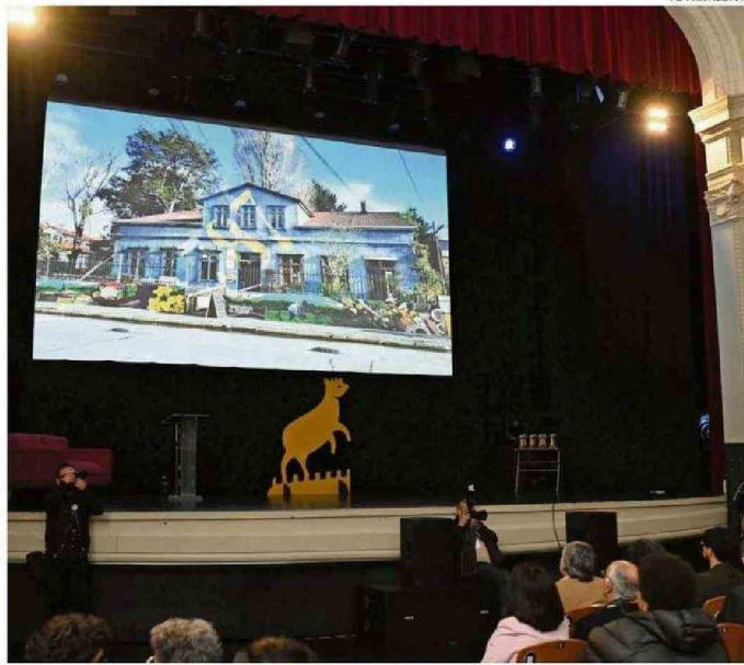
EL EVENTO ESTUVO MARCADO POR EL RECUERDO DEL INCENDIO QUE ACABÓ CON LA CASONA DE PÉREZ ROSALES N°787.