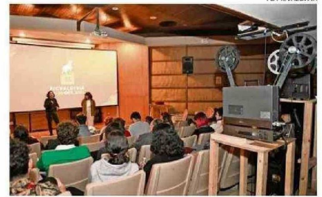
LA PARANINFO UACH FUE UNA DE LAS SALAS DEL EVENTO.