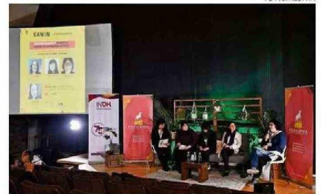
UNO DE LOS CONVERSATORIOS DEL CICLO KAWIN EN EL CECS.