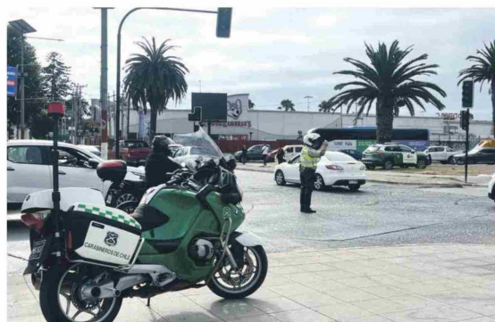
Carabineros ayudó a gestionar el tránsito en las vías afectadas por la falta de semáforos.