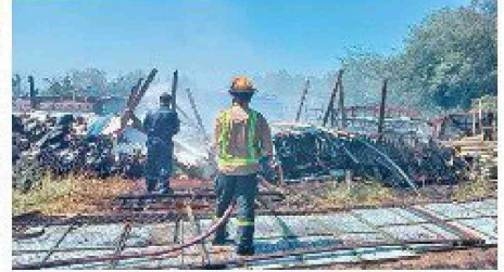
El incendio forestal "Puertas de Fierro" movilizó a cerca de 80 voluntarios de bomberos y también recursos aéreos de CONAF.

De acuerdo con la información proporcionada por CONAF, a eso de las 15:41 horas se declaró la alerta roja de incendio, en donde el sistema de mensajería SAE dio aviso de la evacuación preventiva del sector San Ramón.