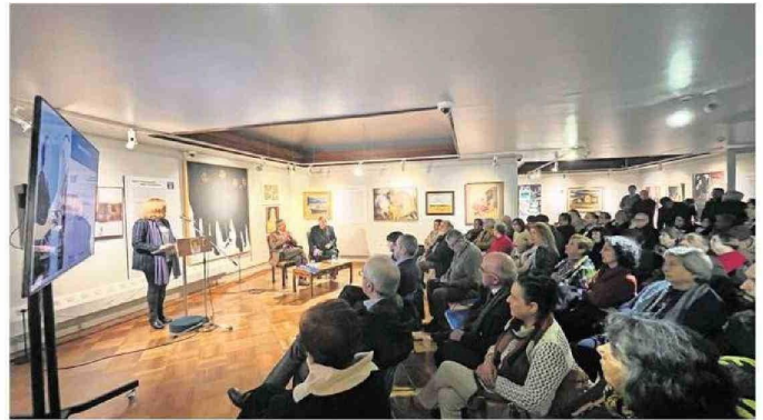
El lanzamiento de la obra tuvo una alta convocatoria interesada en conocer más a la Premio Nobel.

El objetivo de la obra, dijo, es ayudar a dar a conocer a esta gran ausente y desconocida, que "es Gabriela, y a quien merecemos conocer mucho más. A medida que fui estudiando y aprendien-