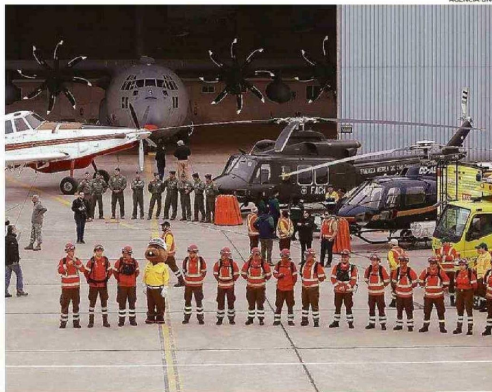
A NUEVE MESES DEL MEGAINCENDIO, LOS ANUNCIOS DE SENAPRED Y CONAF NO CONVENCEN A EXPERTOS.