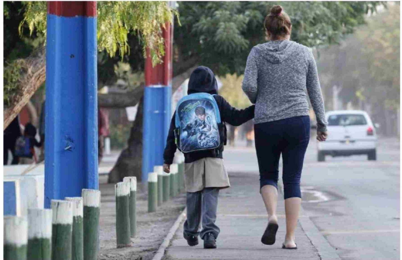
EL REGRESO A CLASES a menudo puede ser fuente de ansiedad para niños, niñas y jóvenes que se enfrentan a un nuevo año escolar.

Un error común entre los progenitores es intentar hacer que los niños se acuesten muy temprano