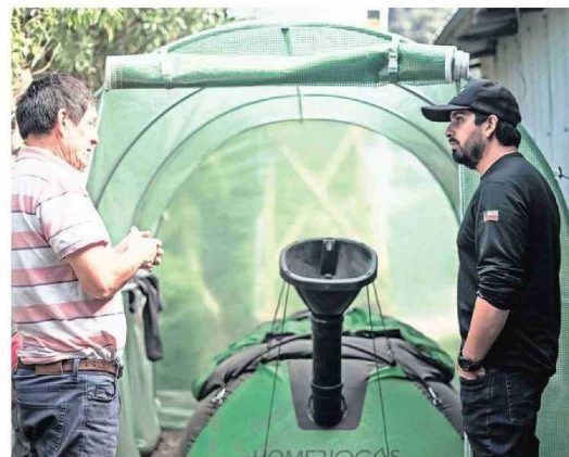
Invernaderos con riego tecnificado fue otro de los avances que el proyecto instaló en la isla.

150 personas, aproximadamente, fueron beneficiadas con la iniciativa, la que contó con un presupuesto de $316 millones.