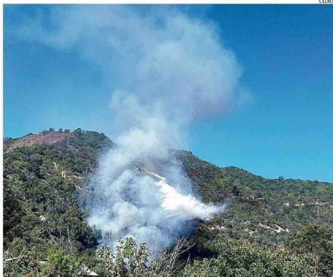
CONAF Y BOMBEROS PUDIERON CONTENER EL INCENDIO DE AYER, PERO LA ALERTA ROJA SIGUE EN PIE.

"Otro tema bastante relevante es que en el sector no hay red de grifos de agua pota-