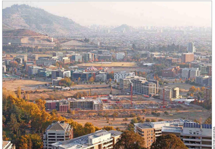
Actualmente, Ciudad Empresarial posee casi un 70% de oficinas y comercio, 20% de universidades y 10% de viviendas. Esta última cifra se espera que aumente “en forma relevante durante los próximos años”, dicen sus desarrolladores.

La universidad con mayor presencia en ese sector es la USS, que cuenta con cinco edi-