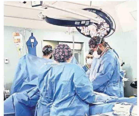
PROCEDIMIENTO SE LLEVÓ A CABO EN EL HOSPITAL DE TALCAHUANO.