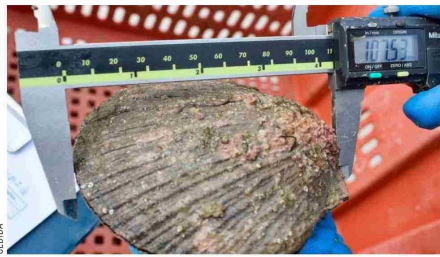
Su extracción termina el 16 de marzo para preservar la especie.

Ximena Gallardo, directora regional de Sernapesca, se refirió al inicio de esta tem