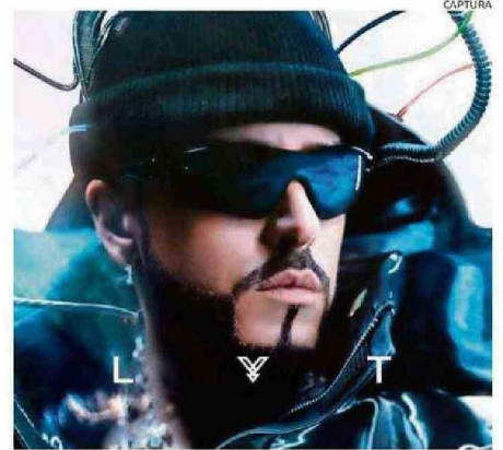
EL NUEVO DISCO SE COMPONE DE 19 CANCIONES.