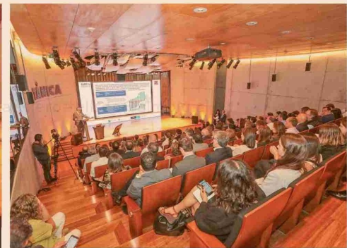
Cerca de 120 invitados se reunieron para participar en esta actividad.